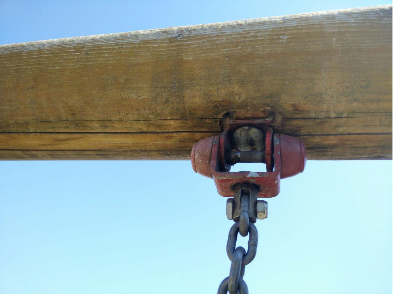
Legno traversa sostegno seggiolini marcescente